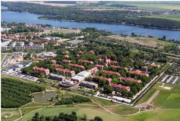
Luftbildaufnahme Ruppiner Kliniken